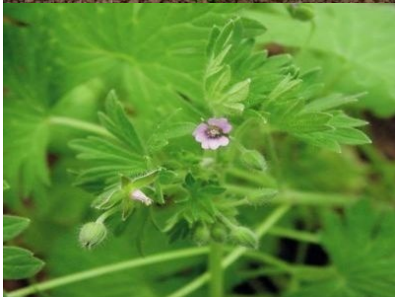
Kakost maličký Geranium pusillum