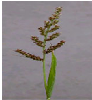
Ježatka kuří noha